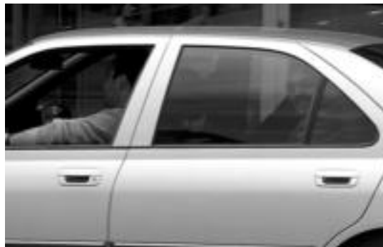
INPUTATUTAKO poliziak, 2002ko ekainean, Donostiako Epaitegian deklaratu ostean, auto barruan alde egiten.

ra zabaltzea proposatu zuen akusazio partikularrak, baina Gipuzkoako Auzitegiak, aste honetako autoan, eskaera atzera bota du, poliziaburuek behar besteko zehaztasunez ez zutela erantzun onartu arren.